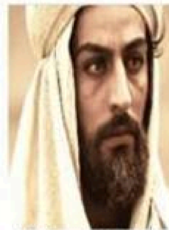
Ali ibn Abi Talib.